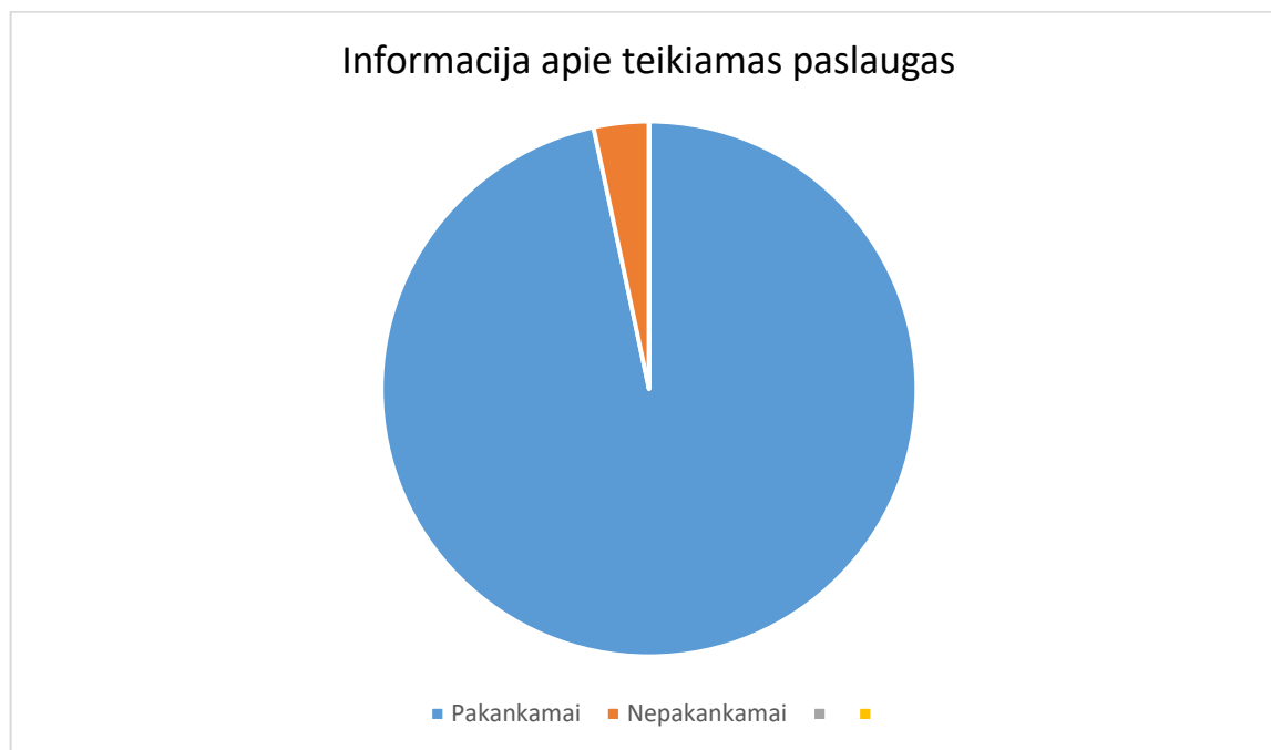
2 diagrama. Informacija apie teikiamas paslaugas.

Iš diagramos matyti, kad 99,99 % apklausoje dalyvavusių paslaugų gavėjų, globos namuose gauna pakankamai informacijos apie teikiamas paslaugas.